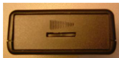
Endring av lydsignal Maks Min

På kortsiden av Timestokken finner du lydreguleringen for endring av lydfrekvens. Når denne er stilt på det laveste, er lyden helt avstengt, og signal blir kun gitt som blinkende prikker.