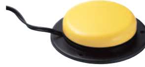
JELLY BEAN TWIST • Art. nr: 621901 • HMS: 160559 Utskiftbare deksler i rød, gul, grønn eller blå medfølger. Mål: Ø 6,5 cm. Trykkraft 70 g.