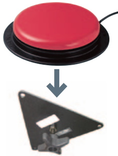
MONTERINGSPLATE TIL BIG RED TWIST • Art. nr: 621915 • HMS: 089637 Stor trekant.