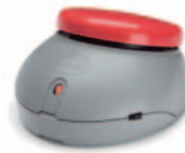
JELLY BEAMER TWIST • Art. nr: 622026 • HMS: 144596 Rød, også i gult. Trådløs bryter. Mottaker følger med. Aktiveres av radiosignaler. Rekkevidde 10 m.