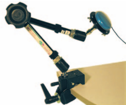
UNIVERSAL MONTERINGSARM MED RATT FOR FIKSERING • Art. nr: 621952 • HMS: 161140 Fleksibelt stativ som bl.a. passer til øvrige brytere med monteringsplater på denne siden. Fikseres i ønsket posisjon ved å skru på rattet.