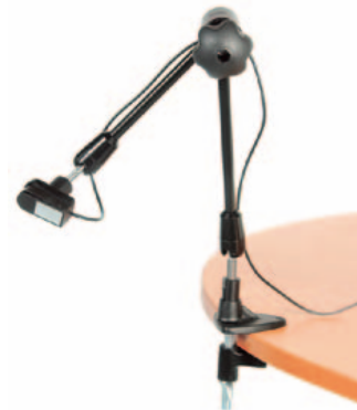
TASH MONTERINGSARM MED RATT • Art. nr: 626600 • HMS: 079745 En fleksibel arm som passer til Mikrolett bryteren med monteringsplate. Fikseres i ønsket posisjon ved å skru på rattet.