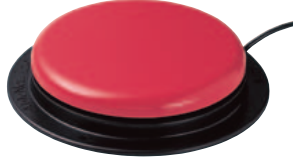
BIG RED TWIST • Art. nr: 621902 • HMS: 160560 Utskiftbare deksler i rød, gul, grønn eller blå medfølger. Mål: Ø 13 cm. Trykkraft 125 g.

Mekaniske brytere gir taktil/auditiv tilbakemelding når de aktiveres.