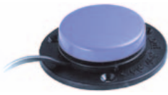
SPECS • Art. nr: 621919 • HMS: 085386 Blå, kommer i flere farger. Mål: Ø 3,4 cm. Trykkraft 80 g.