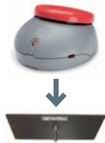
MONTERINGSPLATE TIL JELLY BEAMER • Art. nr: 621916