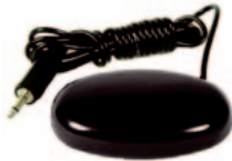
STEALTH EGGBRYTER • Art. nr: 000701 Meget solid bryter som er tilpasset til bruk sammen med Stealth nakkestøtter og festearmer. Bryteren er vannsikret, og kan trygt benyttes på steder som utsettes for væske.