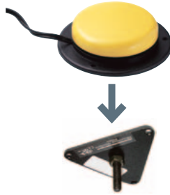
MONTERINGSPLATE TIL JELLY BEAN TWIST • Art. nr: 621929 • HMS: 144382 Liten trekant.