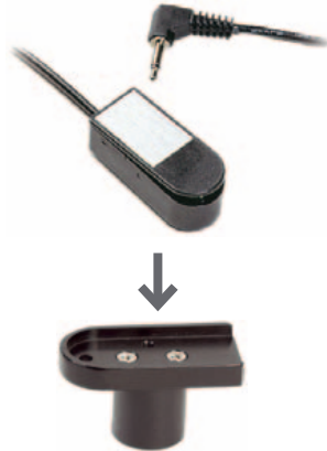
MIKROLETT BRYTER T5850 • Art. nr: 620850 • HMS: 054651